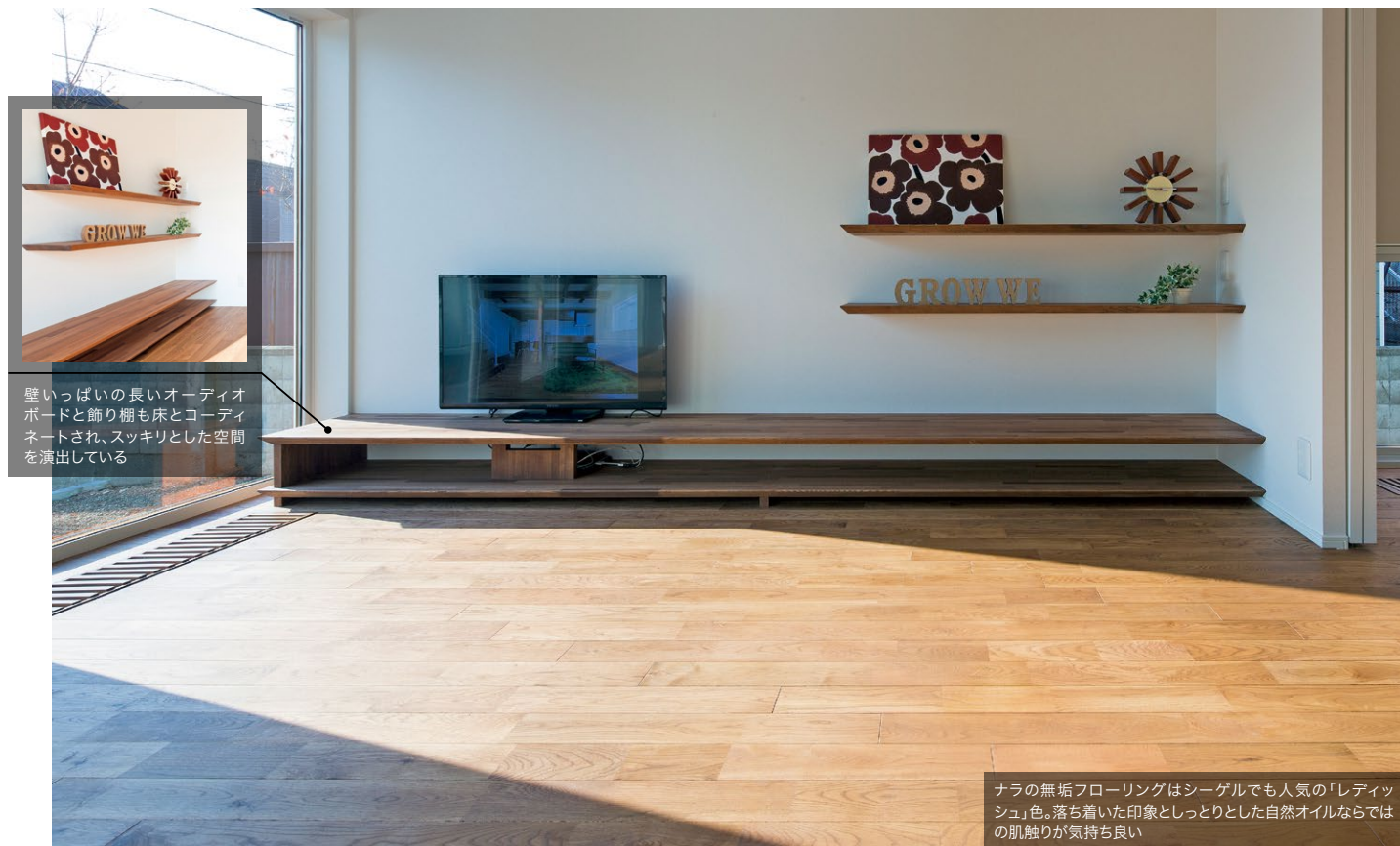
壁いっぱいの長いオーディオボードと飾り棚も床とコーディネートされ、スッキリとした空間を演出している