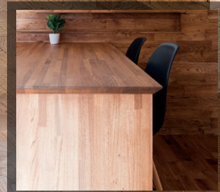
床・壁・天井の意匠にピッタリと馴染んだ別注のダイニングテーブル。市販の家具ではなかなか難しいコーディネートも、シーゲルとのコラボだからこそ可能に