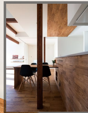
ナラの無垢フローリングを惜しみなくキッチンの壁と天井にも施工。上部の隙間には間接照明を入れている